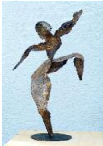
tanz des herkules aus 1mm stahlblech kalt geformt, schweißstrukturoberfläche, gold patiniert, höhe: 42 cm, breite: 23 cm, tiefe: 28 cm, sockel: kreis 13 cm x 0,2, 1 kg