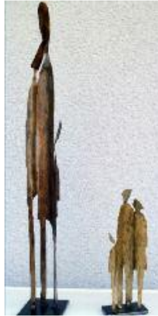
familie schmal und klein 1,5 mm stahlblech 71 und 29 cm hoch