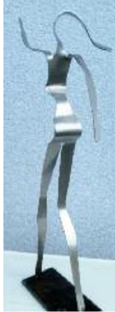
frau gehend 2 mm edelstahlblech 63 cm hoch

alle gezeigten arbeiten stellen muster dar, die auf wunsch in unterschiedlichen größen, materialien und oberflächen als ein persönliches unikat erstellt werden können.