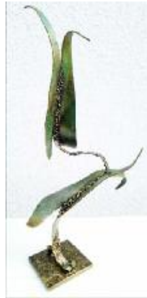
doppelblatt klein aus 2 mm stahlblech kalt geformt, mehrfarbig patiniert, höhe: 45 cm, breite: 20 cm, tiefe: 19 cm, sockel: 10x10x0,5 cm, gewicht: 1 kg