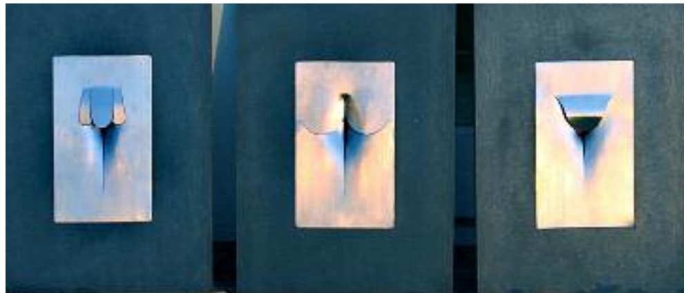
triptychon "drei blumen" aluminium auf holz, gebürstet