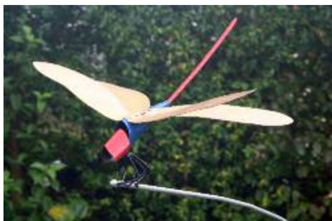
libelle 1 mm stahl, auf 2 m langem 8 mm rundeisen, 5- farbig, 57 cm spannweite, 45 cm lang,