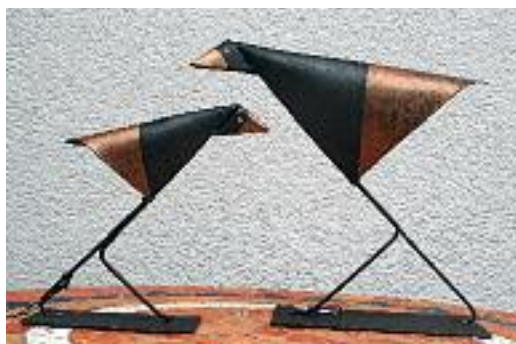
div. kleine design-vögel 2 mm stahl, schwarz-gold (rot) patiniert