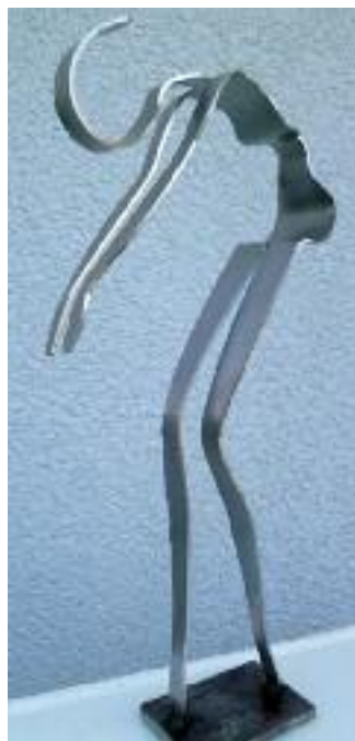
frau gebeugt 2 mm edelstahlblech 37 cm hoch