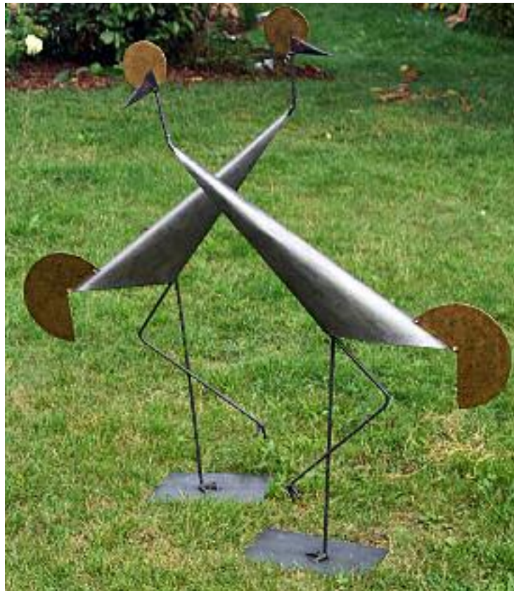
kraniche (stilisiert, rund) groß korpus: 2 mm stahl, 120 cm hoch, 80 cm lang, 20 cm breit, silbrig-gold patiniert, gewicht 6 kg

alle gezeigten arbeiten stellen muster dar, die auf wunsch in unterschiedlichen größen, materialien und oberflächen als ein persönliches unikat erstellt werden können.