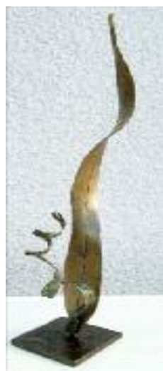
spitzes blatt aus 2 mm stahlblech kalt geformt, mehrfarbig patiniert, höhe: 47 cm, breite: 15 cm, tiefe: 15 cm, sockel: 20 x 30 x 0,5 cm, gewicht: 1 kg