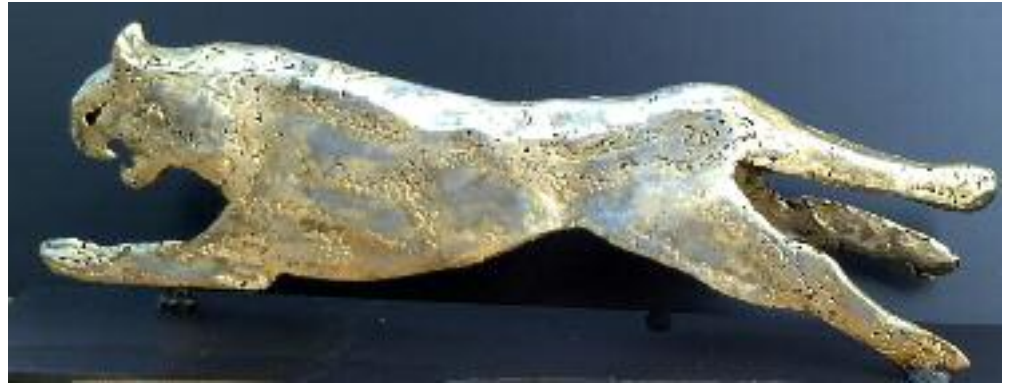
jaguar (halb-massiv) aus 1 - 2 mm stahlblech aufbaugeschweißt, gold patiniert, höhe: 18 cm, breite: 51 cm, tiefe: 10 cm, sockel: 10 x 60 x 1,0 cm metall, gewicht: 5 kg

alle gezeigten arbeiten stellen muster dar, die auf wunsch in unterschiedlichen größen, materialien und oberflächen als ein persönliches unikat erstellt werden können.