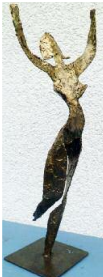
li: tanzende aus 1,5 mm stahl- blech kalt geformt, mit gespachtelter oberflächenstruktur, gold patiniert, höhe: 46 cm breite: 15, tiefe: 16 cm