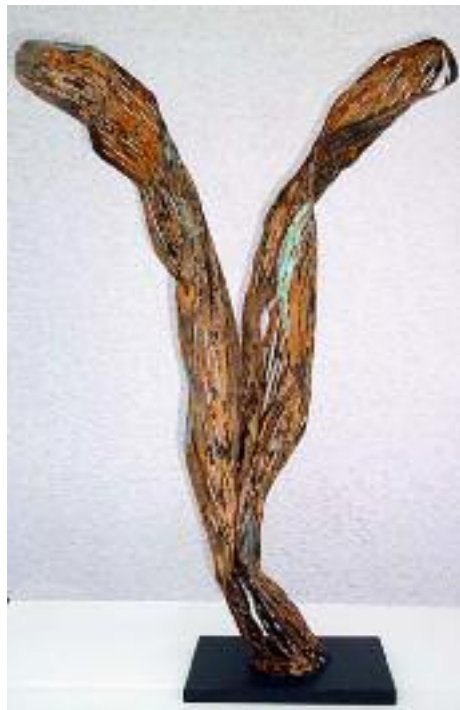
morb. blatt II aus 1mm stahlblech geformt, kupfer patiniert, höhe: 67 cm, breite: 43 cm, tiefe: 28 cm, sockel: 20 x 10 x 0,5 cm metall, gewicht: 3,8 kg