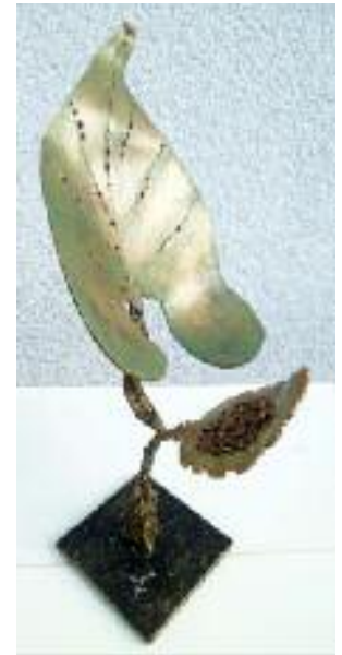
blatt mit blüte aus 2 mm stahlblech kalt geformt, mehrfarbig patiniert, höhe: 35 cm, breite: 15 cm, tiefe: 18 cm, sockel: 10x10x0,5 cm, gewicht: 1 kg