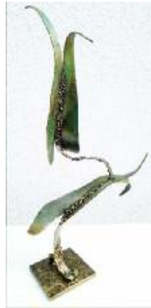
doppelblatt klein aus 2 mm stahlblech kalt geformt, mehrfarbig patiniert, höhe: 45 cm, breite: 20 cm, tiefe: 19 cm, sockel: 10x10x0,5 cm, gewicht: 1 kg