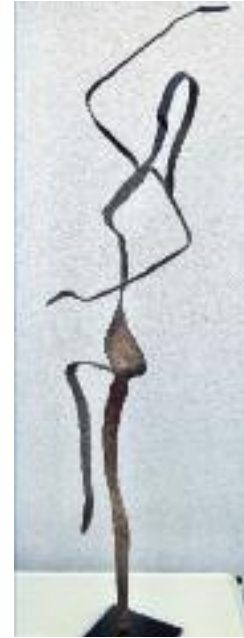
tänzerin strukturierte oberfl. 1,5 mm stahlblech 105 cm hoch