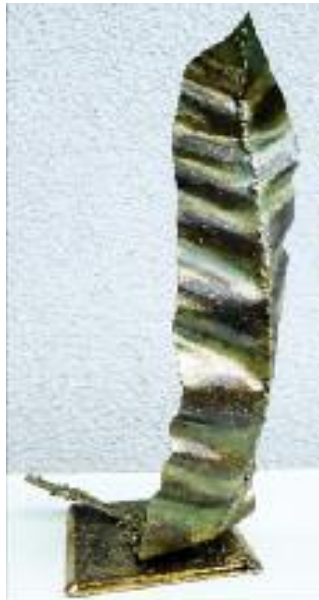
blatt aus 1 mm stahlblech kalt geformt, mehrfarbig patiniert, höhe: 36 cm, breite: 15 cm, tiefe: 14 cm, sockel: 12 x 13 x 0,6 cm, gewicht: 800 g

alle gezeigten arbeiten stellen muster dar, die auf wunsch in unterschiedlichen größen, materialien und oberflächen als ein persönliches unikat erstellt werden können.