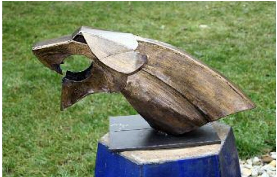
pantherkopf (segmentiert) 2 mm stahlblech, gold patiniert

alle gezeigten arbeiten stellen muster dar, die auf wunsch in unterschiedlichen größen, materialien und oberflächen als ein persönliches unikat erstellt werden können.