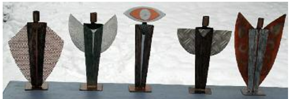
engel (abstrahiert) 2 mm stahlblech mit versch. materialien und farben

tel: 09134 / 4131 fax: 09134 / 706006 mail: rk@objekt-art.com www.ragnwolf-art.com