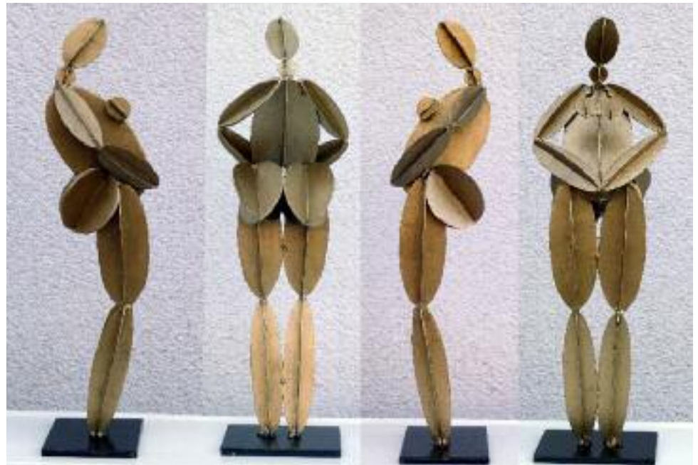
kreiselemente-figur (schwängere) (4 ansichten) 2 mm stahl geschweißt, schwarz-gold patiniert 50 cm hoch, sockel: 14 x 10 cm

alle gezeigten arbeiten stellen muster dar, die auf wunsch in unterschiedlichen größen, materialien und oberflächen als ein persönliches unikat erstellt werden können.