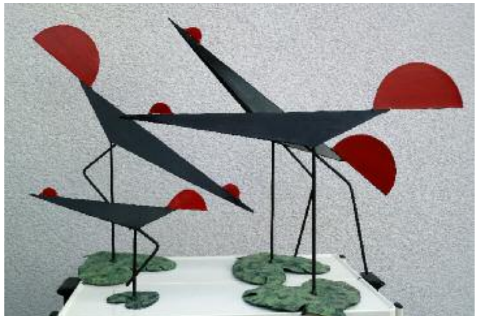
kraniche (stilisiert, kantig) 2 mm stahl geschweißt, schwarz-rot-grün patiniert 45 und 55 cm hoch, 65 cm lang, sockel (blattform): 25 x 25 cm