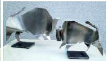
2 stiere 2 mm edelstahlblech 24 cm hoch, 36 cm lang 18 cm hoch, 27 cm lang