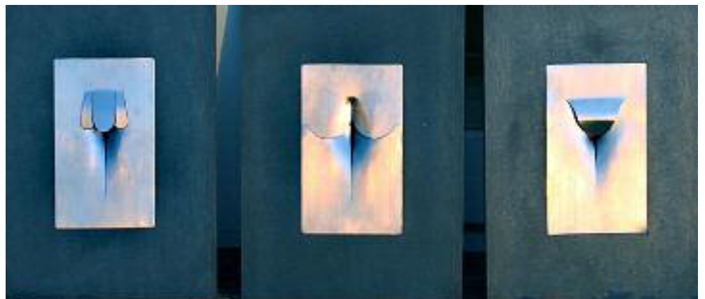
triptychon "drei blumen" aluminium auf holz, gebürstet