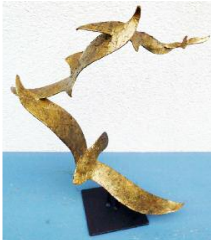
4 sturmvögel aus 2 mm stahl- blech kalt geformt, mit oberflächen- struktur, gold pati- niert, höhe: 52 cm, breite: 43 cm tiefe: 23 cm sockel: 14 x 15 x 0,5 cm