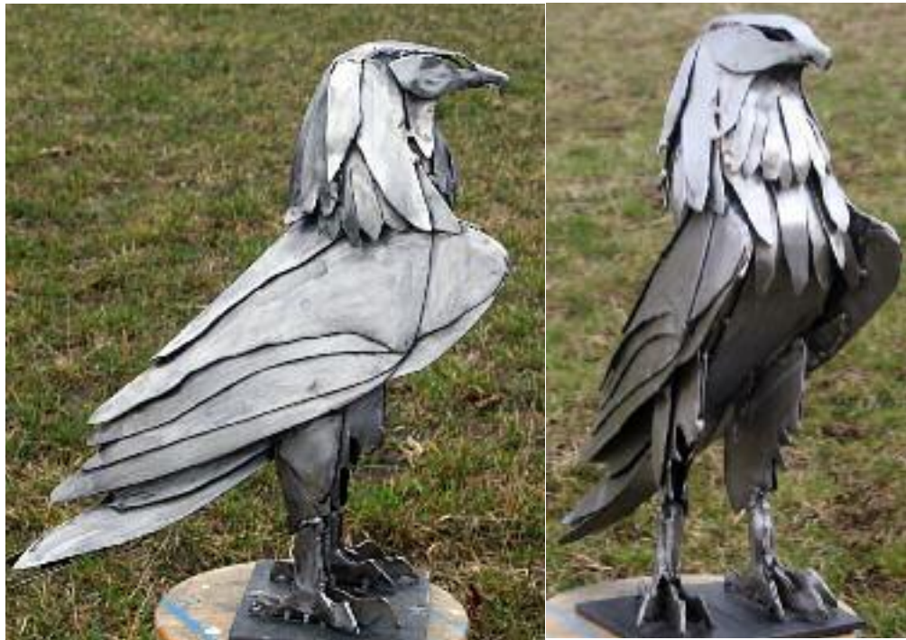
raubvogel 2 mm stahl massiv, plattentechnik, geschliffen, lackiert 55 cm hoch, 50 cm lang, 20 cm breit, Gewicht 12,5 kg

alle gezeigten arbeiten stellen muster dar, die auf wunsch in unterschiedlichen größen, materialien und oberflächen als ein persönliches unikat erstellt werden können.