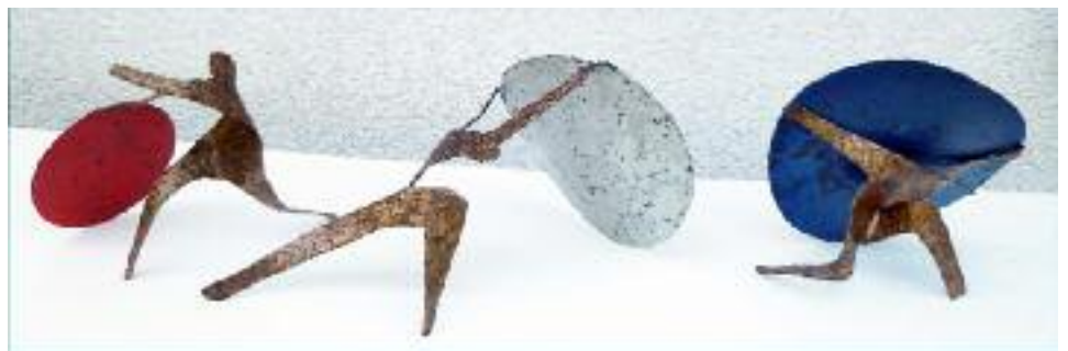
triptychon: mensch und kreis

aus 2 mm stahlblech kalt geformt, verschiedenfarbig patiniert, li: kind mit rad, mi: sisyphos, re: atlas