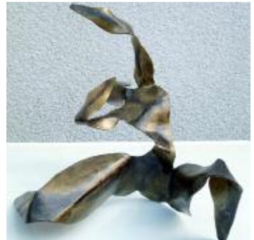
angst des herkules aus 2 mm stahlblech kalt geformt, gold / schwarz patiniert, 27 cm hoch, 27 cm breit, 30 cm tief, sockel: 10 x 5 x 1 cm