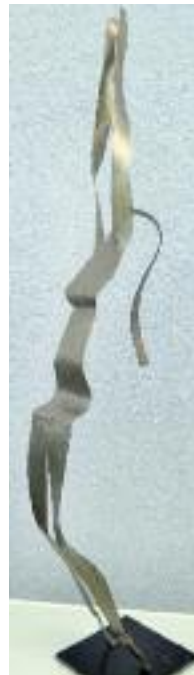
frau gestreckt 2 mm stahlblech 126 cm hoch