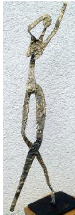
re: taumelnde aus 1,5 mm stahlblech kalt geformt, mit verzinnter oberflächenstruktur, gold patiniert, höhe: 44 cm, breite: 23 cm, tiefe: 16 cm,