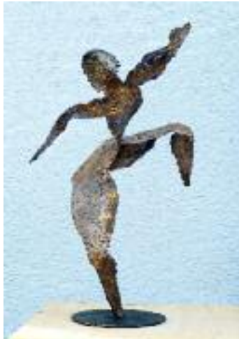
tanz des herkules aus 1mm stahlblech kalt geformt, schweiß- strukturoberfläche, gold patiniert, höhe: 42 cm, breite: 23 cm, tiefe: 28 cm, sockel: kreis 13 cm x 0,2, 1 kg