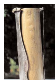
vase rund 2 mm stahl gold-silber-schwarz pat.