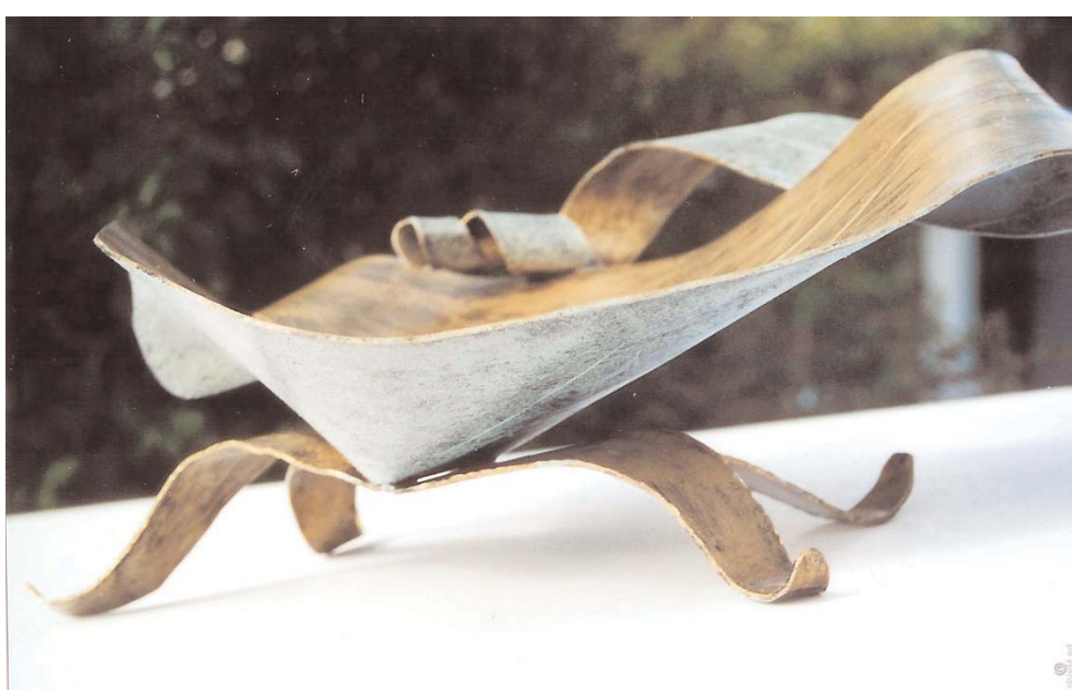
blatt-schale 2 mm stahl bunt lackiert/patiniert