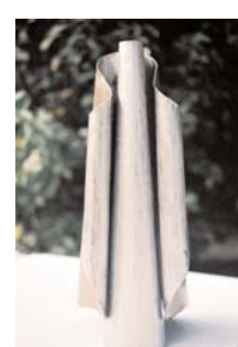
vase 2x gerollt b 2 mm stahl gold-silber patiniert