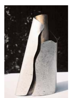
vase asymmetrisch 2 mm stahl gold-silber patiniert