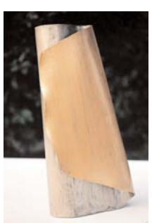
vase oval 2 mm stahl gold-silber patiniert