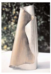
vase 2x gerollt a 2 mm stahl gold-silber patiniert