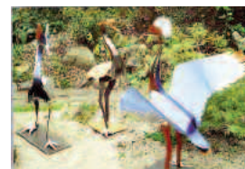
kraniche 2/1 mm stahl mehrfarbig lackiert