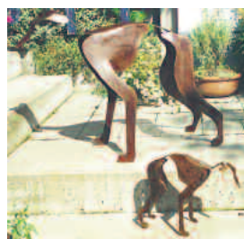
windhunde 2 mm stahl gerostet, lackiert