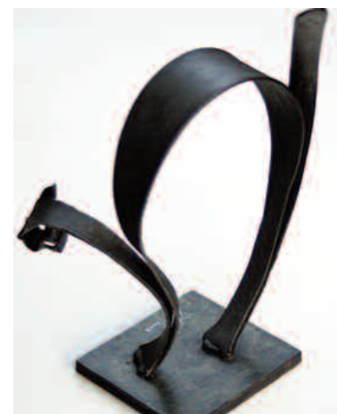
streifenkatze 2 mm stahl schwarz patiniert