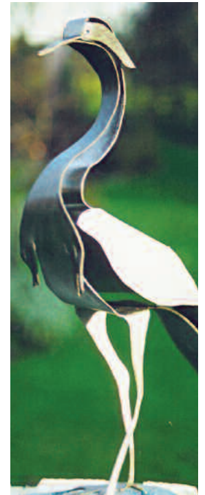
kranich klein 2 mm stahl silber lackiert