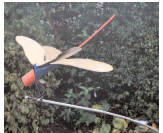
libelle auf halm 1-2 mm stahl bunt patiniert