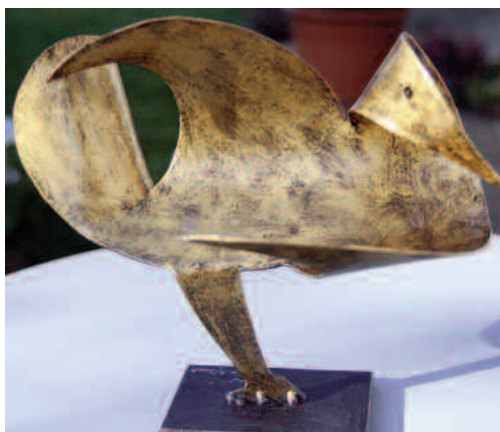
kreisvogel , 2 mm stahl, gold patiniert