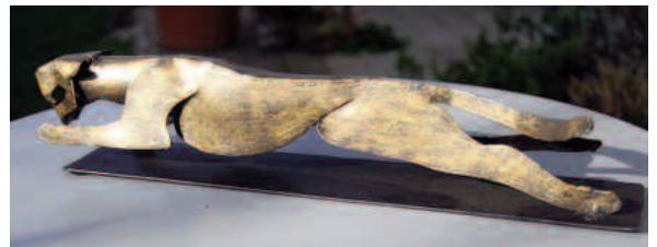
gepard im sprung 1 mm stahl, gold patiniert