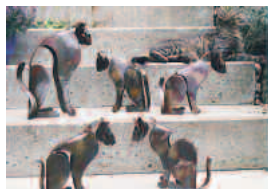
katzen 2 mm stahl gerostet/bunt lackiert