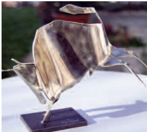
stier e1 (2mm edelstahl)