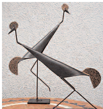
kraniche abstr., 2 mm stahl, schwarz-gold patiniert