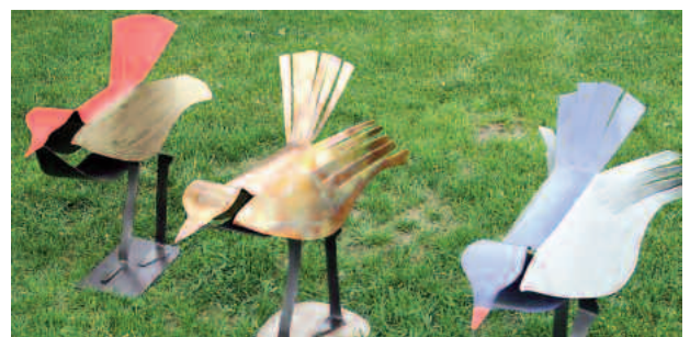
drei vögel bunt 2 mm stahl, 1 mm kupfer bunt lackiert bzw. geflammt/lackiert