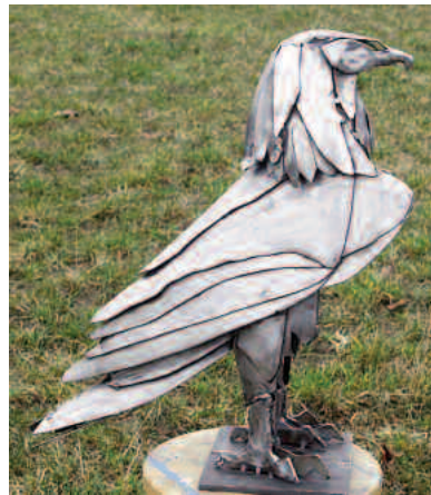
raubvogel 2 mm stahl massiv blank geschliffen, lackiert (siehe auch seite "neues aus der werkstatt metall")