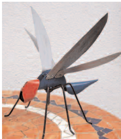
mücke 1 mm stahl, bunt patiniert

1-2 mm stahl , schwarz-gold/rot patiniert