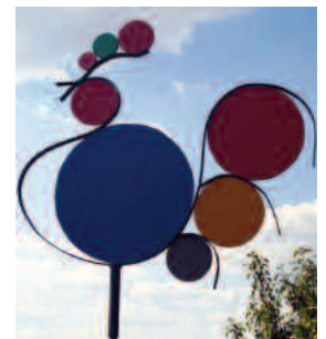
wetterhahn 2 mm stahl / farbiger Kunststoff