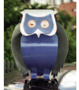
eule klassisch 1 mm stahl bunt lackiert