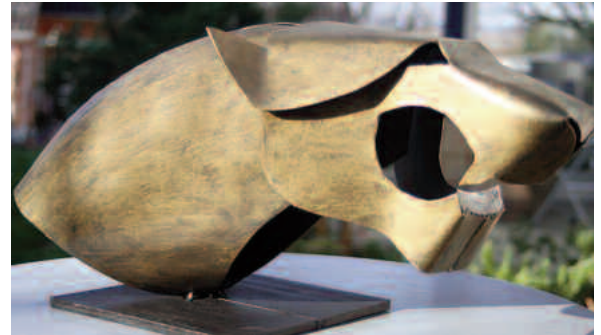
pantherkopf gr 2 mm stahl, gold patiniert