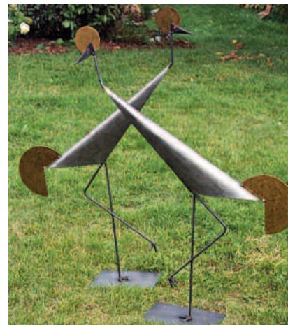
kraniche abstrakt 2 mm stahl schwarz-gold lpatiniert