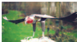
condor 1 mm stahl mehrfarbig lackiert