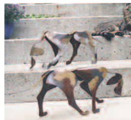
hunde 2 mm stahl gerostet, bunt lackiert