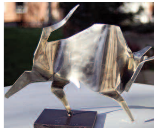
stier e2 (2mm edelstahl)