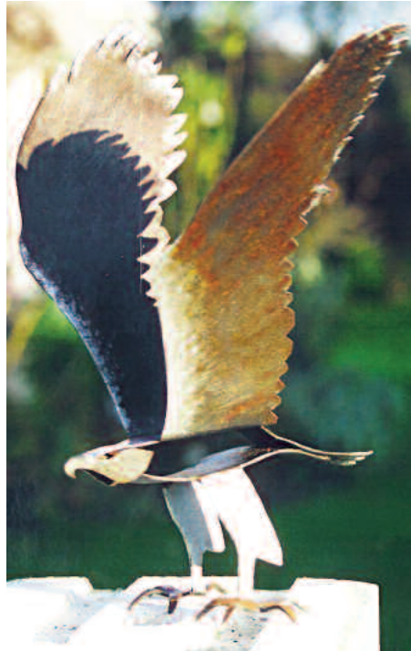
adler 2 mm stahl silberpatiniert