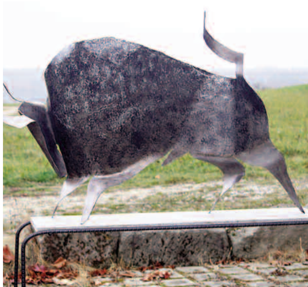
stier groß 2 mm stahl, schwarz/silber lackiert