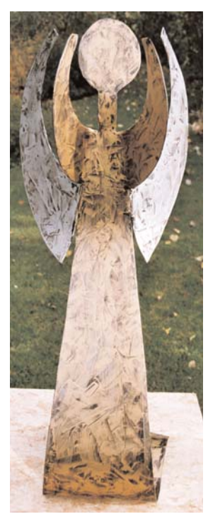
engel 2 mm stahl schwarz-gold lackiert