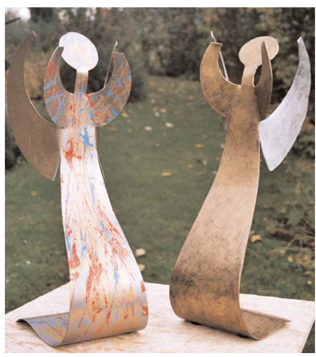
engel 2 mm stahl bunt lackiert