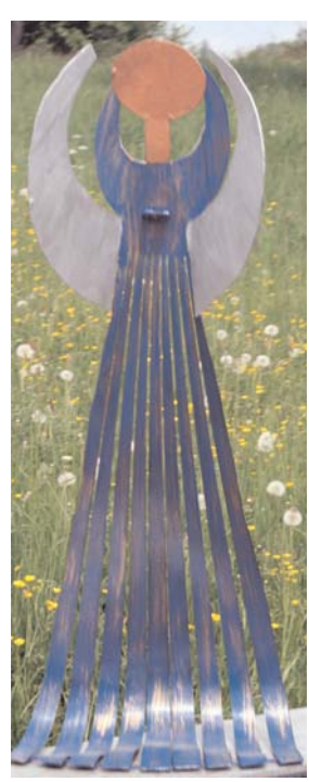
engel geschnitten 2 mm stahl bunt lackiert