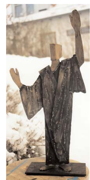
schutzheiliger 2 mm stahl bunt lackiert,zier-gelötet