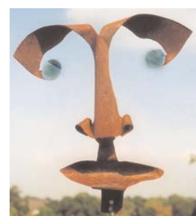
rankstab gesicht 1 mm stahl gerostet