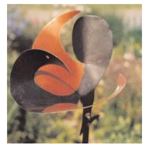
rankstab vogel I 1 mm titanzink bunt lackiert