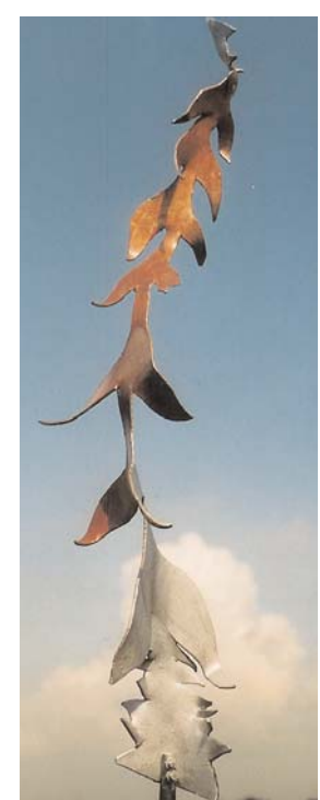
rankstab löwenzahn 2 mm stahl bunt lackiert