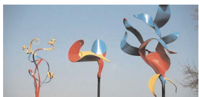
drei rankstäbe 2 mm stahl bunt lackiert