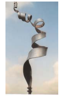
rankstab ranke II 2 mm stahl silber-gold lackiert