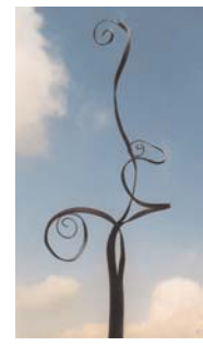
rankstab ranke I 2 mm stahl schwarz lackiert