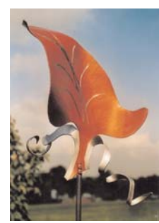
rankstab blatt II 2 mm stahl bunt lackiert