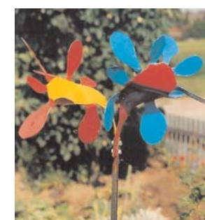
rankstab kaktus 2 mm stahl bunt lackiert