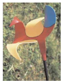
rankstab vogel II 2 mm stahl bunt lackiert